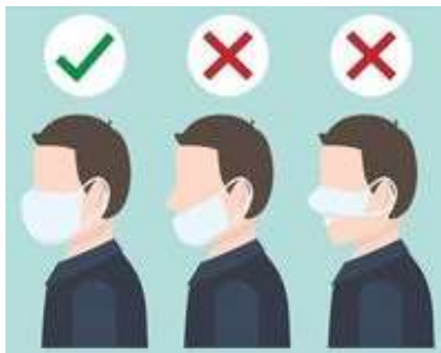
Pravilna upotreba zaštitne maske

Platnena maska je za višekratnu upotrebu. Već korišćena maska se iskuvava na temperaturi 95°C u mašini ili u kuhinjskoj posudi. Nakon iskuvavanja i sušenja, maska se pegla i spremna je za ponovno korišćenje.