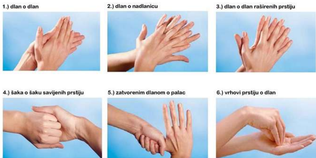
Pravilno pranje ruku