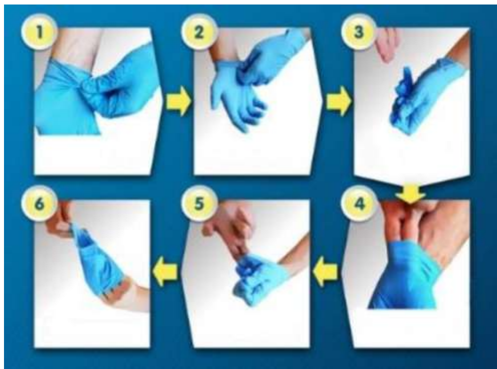
Pravilno skidanje rukavica